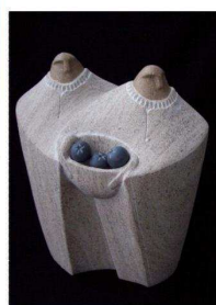
Alain Dionne « Les Bleuets »